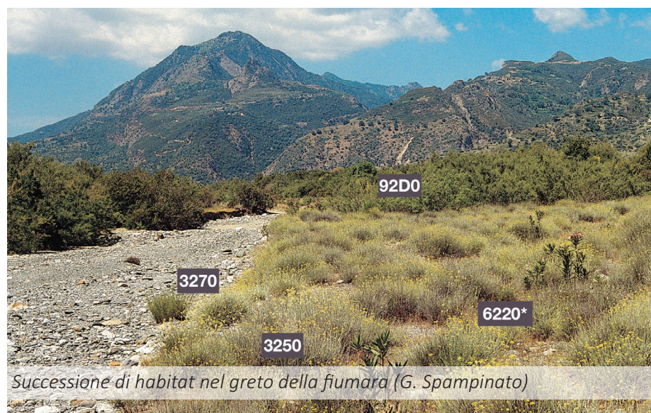
Successione di habitat nel greto della fiumara (G. Spampinato)