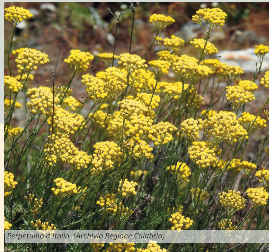
Perpetuino d'Italia

Fattori di minaccia per le due specie che nidificano sulla spiaggia (la tartaruga marina caretta ed il fraterno) sono gli interventi di pulizia meccanica degli arenili, ma anche le attività turistico-balneare e l'insieme di interventi e servizi ad essa connessi che comportano disturbo ed alterazione dell'ambiente litoraneo; ma anche l'illuminazione di strade, edifici ed attività prospicienti la spiaggia e la frequentazione notturna che comporti emissioni sonore o luminose.