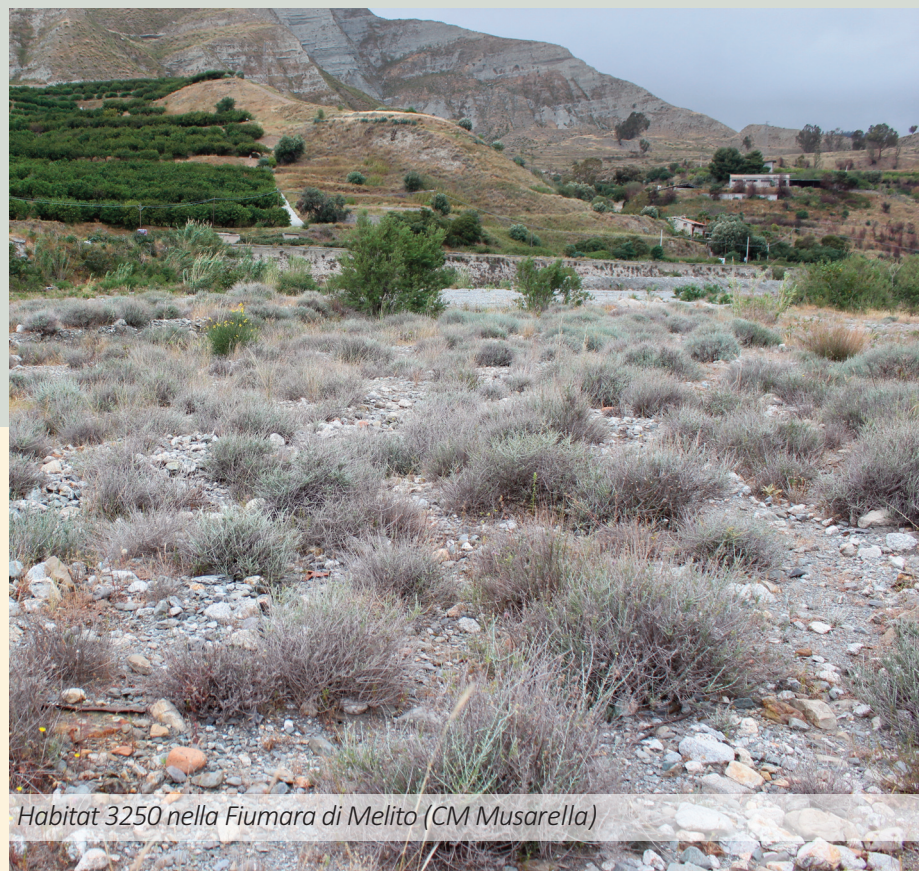
Habitat 3250 nella Fiumara di Melito (CM Musarella)

Questo sito si trova in un mediocre stato di conservazione per l'incidenza di diversi fattori di pressione e di minaccia che alterano la struttura e la funzione degli habitat, agendo anche sulle popolazioni delle specie presenti nella ZSC. All'inquinamento del suolo di varia origine (scarichi fognari e agricoltura soprattutto) e da rifiuti solidi, si aggiungono lo scarico e il deposito di materiali inerti, l'estrazione delle ghiaie e sabbie dall'alveo fluviale e la presenza di specie esotiche. Tutti fattori che sono favoriti dalla presenza di strade in alveo.